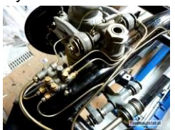
Hydraulische – Schmierung - Benzin und Bremsen Anlagen

Alle Teile präsentiert in Bildern sind Original, nach der Renovierung.