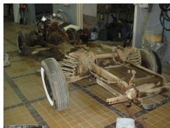
Rahmen und Achsen (Galvanisation, Chrom, Rost Score)